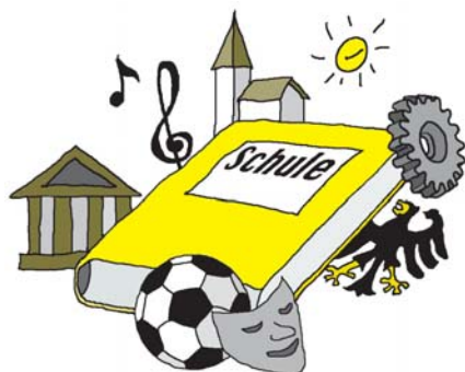
Logo des Projektes Kooperation von Schule mit außerschulischen Akteuren

Unerlässliche Bedingungen für das Gelingen sind einerseits das Engagement von Schulleitung und Lehrkräften sowie deren generelle Bereitschaft zur Kooperation mit externen Partnern, andererseits das Engagement zuverlässiger, professionell arbeitender Kooperationspartner. Die Qualifikationen auf Seiten der Kooperationspartner müssten sich sowohl auf fachliche als auch auf pädagogische