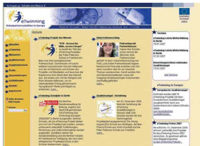
Die Homepage www.etwinning.de

Ob eTwinning im laufenden Unterricht integriert oder im Nachmittagsprogramm angeboten wird, spielt dabei keine Rolle. eTwinning lässt sich entsprechend der jeweiligen Wünsche und Voraussetzungen in der Schule individuell planen. Auch integrierte Konzepte sind denkbar.