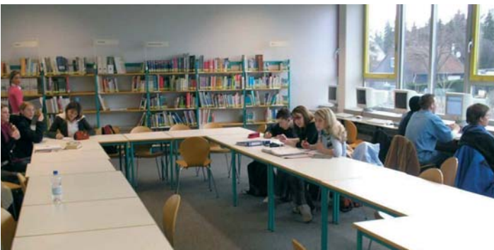
Freier Lernort – Bibliothek

Am „Tag der Offenen Tür“, der regelmäßig am zweiten Samstag im Januar stattfindet, treffen sich die Jugendlichen mit den Wirtschafts juniorern in der Bibliothek, einem unserer Freien Lernorte, der häufig multifunktional genutzt wird. In diesem ca. 100qm großen Raum mit einer langen